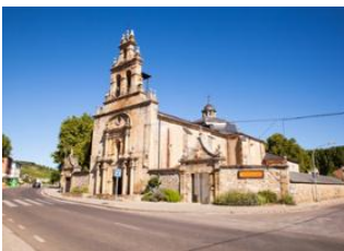
Los Llanos de Aridane