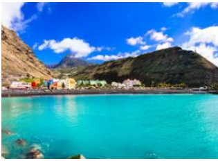
Los Llanos de Aridane