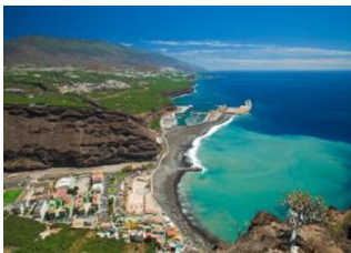
La Palma 📍