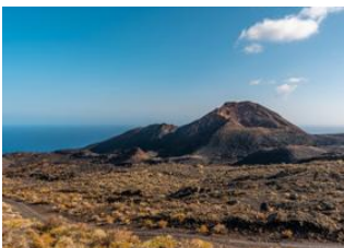
Los Llanos de Aridane