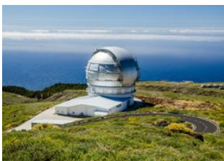
La Palma 📍