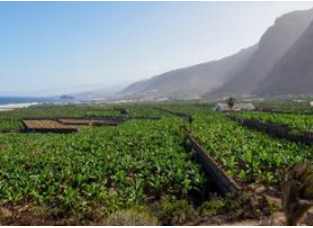
Parc National Teide