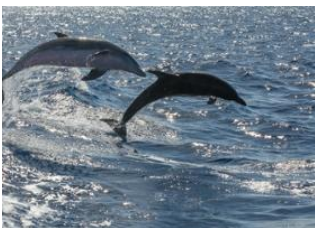
Tenerife 📍 Los Gigantes 📍 Icod de los Vinos 📍