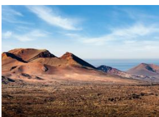
Parc National Timanfaya