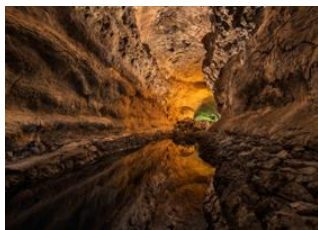
Mirador del Río